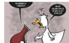
Rubén | Ser O No Ser